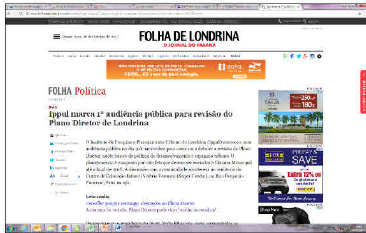
Figura 02: Convite / Cartaz da 1ª Audiência de revisão do PDML