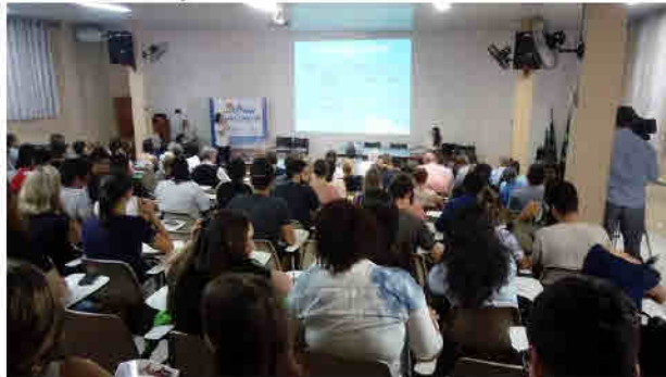
Figura 05: Apresentação da Proposta Metodológica