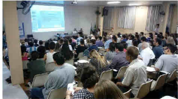
Figura 04: Apresentação da Proposta Metodológica