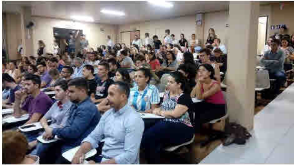
Figura 03: Abertura da 1ª Audiência