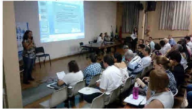
Figura 06: Contribuições da Plenária"